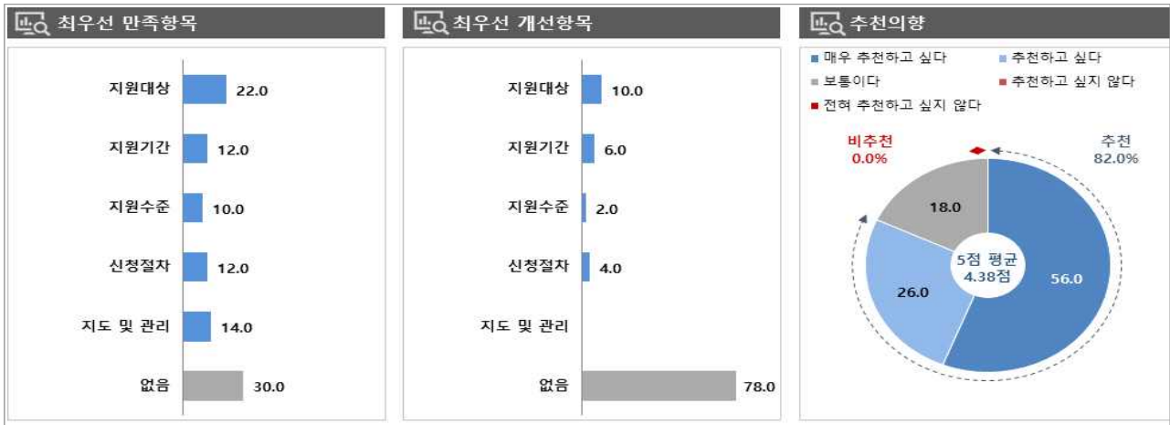
[그림 1] 고용안정장려금(일가정 양립 환경개선 지원) 만족/개선 항목 및 추천 의향